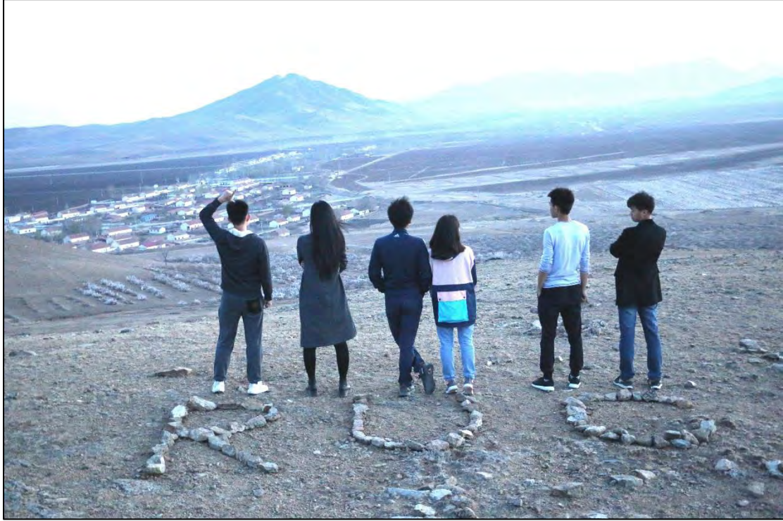
圖 23 中國內蒙古自治區赤峰市巴林左旗林東鎮後興隆地村（後山）