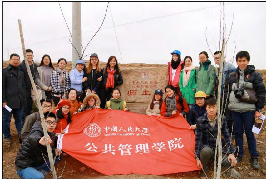
圖 11 公共管理學院內蒙古後興隆地村實察

這是個難得的機會，可以透過課程的方式，進入中國北方的鄉村。後興隆地村與中國人民大學公共管理學院簽下 20 年的師生教育基地合約，希望透過理論與實務的互動，可以增加學生學習的機會，以及增進後興隆地村村民的生活環境之改善。除了上述外，後興隆地村也因與東阿阿膠股份有限公司簽約，作為養驢培養基地，故村子裡的許多建設也由東阿阿膠公司提供，並與村民簽約，一同飼養製作「阿膠」的驢。