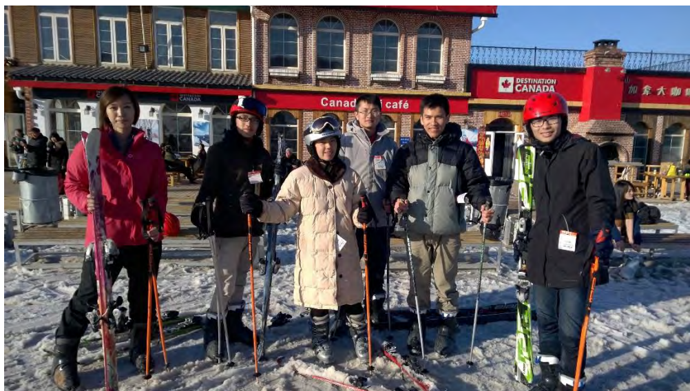
圖 16 北京市密雲區南山滑雪場

研究生在中國算成人，不能購買半價的學生票。由於中國到處都要門票，而一般大學（含）在學生以下的人都可以憑學生證購買「半價」的學生票。不要小看「半價」兩個字，中國許多景點的門票都是幾百人民幣在計價，所以一打完五折下來就非常地可觀。