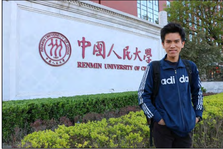
圖 1 中國人民大學西門

(我的 Wechat 微信：paladinhao-sean，有什麼問題，歡迎與我聯繫哦~)