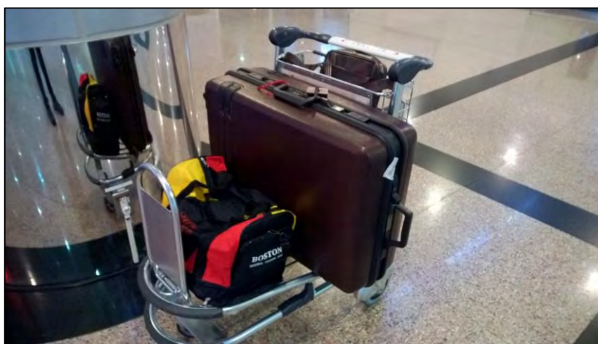
圖 3 我的出發行李（身後還有一個大背包，拍攝於桃園機場）

我是第二學期前往中國人民大學進行交換學生活動，需要備妥許多「厚重」的冬季衣服以及部分的夏季服裝；藥房調劑的感冒藥、腸胃藥等等藥品（一般成藥，如普拿疼等等也可以，不過效力可能沒有調劑藥品強，因為據說中國的病毒很厲害，不過我帶過去的藥品後來都給周遭的臺灣同學吃，自己不曾吃過）；筆記型電腦等等。由於我帶的東西比較齊全（衣架、牙膏、牙刷、刮鬍刀、杯子、西裝、皮鞋、工具書、輕便熨斗等等），所以我的行李差一點超重（29.2 公斤）。其實北京的日用品取得還算方便，人大西門有一家「城鄉倉儲大超市」；東門附近有家樂福，學校裡面也有許多超市，所以日常用品可以在當地購買即可，不過普遍都比臺灣貴一到兩成。