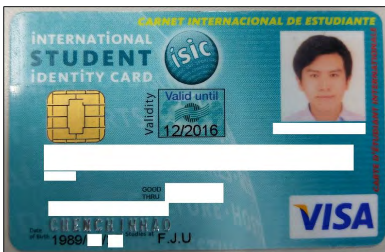
圖 17 國際學生證（附有臺灣銀行 VISA 金融卡功能）

在這趟旅程當中，我主要的旅行範圍都圍繞在北京附近，這在此次的交換旅途當中，算是比較可惜的事情。在中國旅行，主要都得依靠手機 App 訂火車票、訂飯店、訂機票，如果沒有事先規劃與預定，將可能沒有車可坐、沒有飯店可住的窘境。市面上已有多款旅行 App，我主要使用「去哪兒」，通常會先在電腦上「去哪兒」的網頁上操作好之後，再用手機付款（可以使用支付寶或微信支付，只要在同一個會員帳號裡面操作，電腦與手機的資料就會自動聯動），雖然去哪兒 App 裡面的車票、機票、飯店價格不是最便宜，但是它規模最大，也最廣泛，是比較適合我們這種短期旅居的交換學生使用。走過了北京市、山東省（濟南、曲阜、泰山、青島）、天津市、河北省（承德、秦皇島、唐山）、遼寧省（葫蘆島）、內蒙古自治區（赤峰）、江蘇省（南京）、福建省（晉江、泉州、廈門）。而上述的南京與福建，則是利用我學期結束後，沿路南下遊玩的。有別於多數交換生選擇搭乘飛機回國，我選擇搭乘小三通（船＋國內班機）回國，不過不建議會暈船的同學們選擇小三通，因為船真的很晃，且這一趟下來，也不會必直飛飛機來得便宜，且必須拖著大行李廂南下，不過也別有一番風味的。