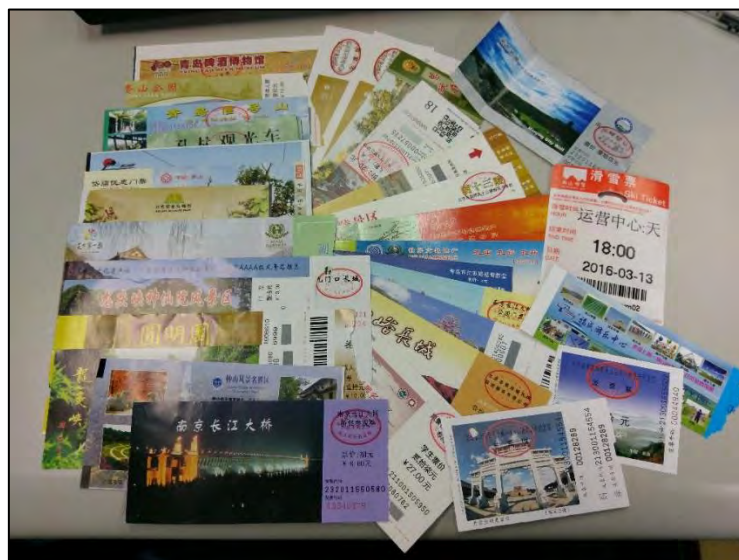
圖 15 在中國所使用的門票

中國到處都要門票。初到中國，感到最不習慣的就是到處都要門票，連在臺灣一般認為不需要門票的地方都要門票，有些地方買了門票進入之後，還要買第二張門票才能繼續前往，例如公園、寺廟，而且這些門票的售價都不便宜。下面是這半年來所使用的門票。舉個例子，你到行天宮、龍山寺拜拜要買門票，每張 20 元人民幣（折合新臺幣約 100 元）、去象山公園看的 101 夜景也要門票，每張人民幣 14 元（折合新臺幣約 70 元）等等。