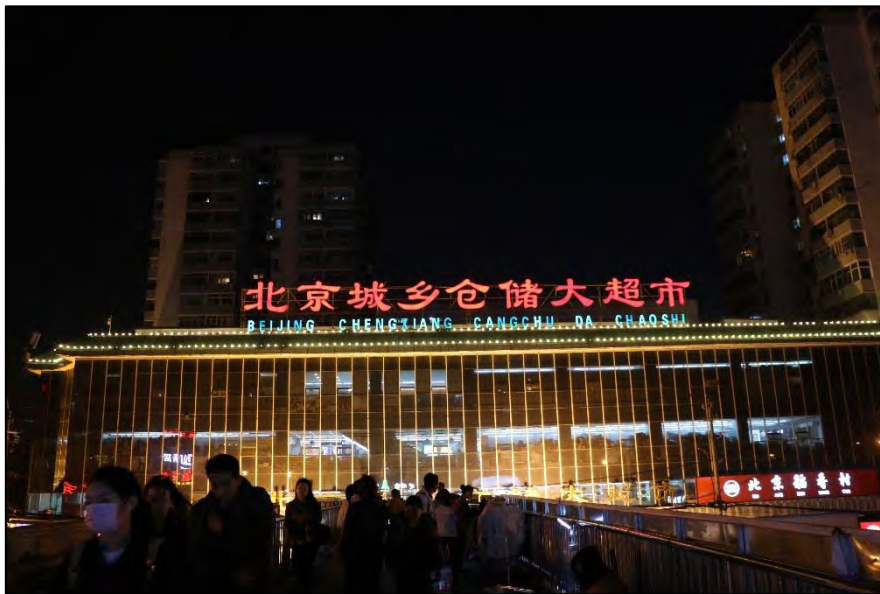
圖 6 北京城鄉倉儲大超市蘇州街店（位於人大西門外）

在北京，日常用品普遍都比臺灣貴一到兩成，食堂（學校內的餐廳稱呼）以及學校外的餐飲費用與臺灣相當，甚至更貴（一個社會學觀察，在北京的一般打工、大學生實習的薪水較臺灣低，但物價皆比臺灣高出許多，如此，居住在北京的居民如何因應生活而取得平衡？）。在中國，大學與當地周遭社區的連結較不密切，所以大學生的生活所需，大部分都在學校裡面的食堂、餐廳、超市解決。人民大學內共有東區食堂、西區食堂、中區食堂、北區食堂、北園食堂、南區食堂八百碗餐廳（2016.08.01 已停止營業）、集天餐廳、留學生餐廳，還有許多超市、咖啡廳，儼然就是一個小型社區，但即便是學校裡面的超市，賣的東西也不見得比校外便宜，仍需貨比三家。