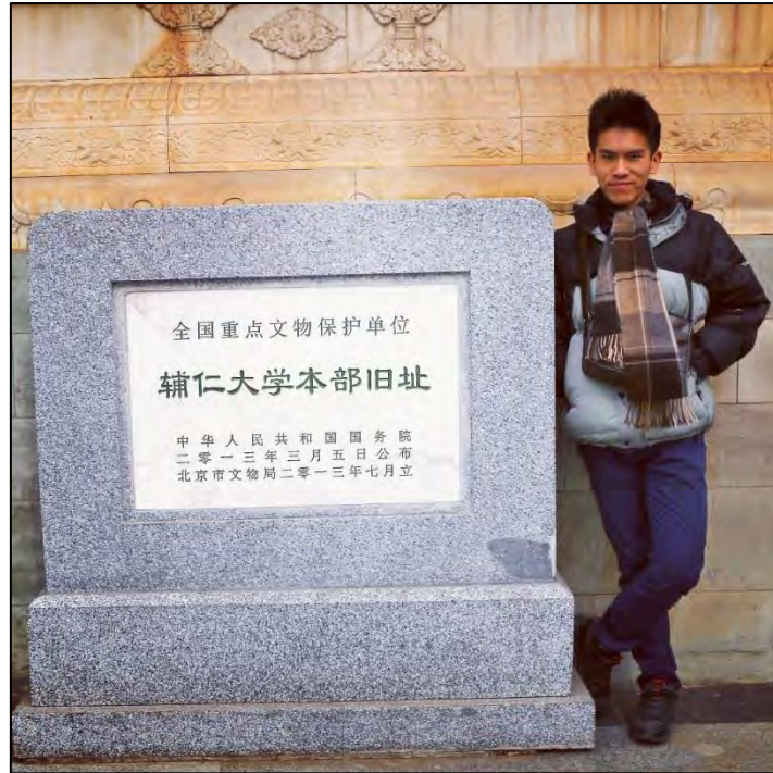
圖 8 北京師範大學北校區（天主教輔仁大學北平舊址）