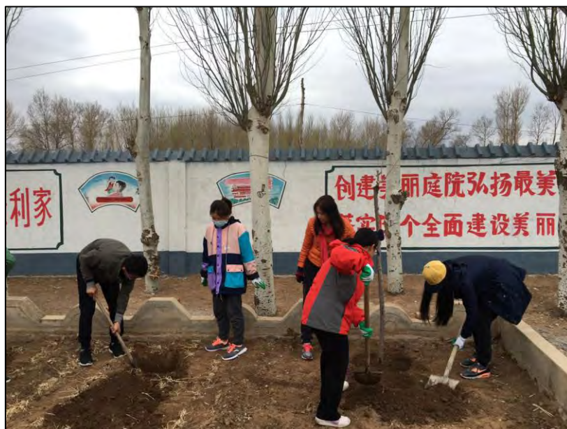
圖 12 協助後興隆地村栽樹

這是個難得的機會，可以透過課程的方式，進入中國北方的鄉村。後興隆地村與中國人民大學公共管理學院簽下 20 年的師生教育基地合約，希望透過理論與實務的互動，可以增加學生學習的機會，以及增進後興隆地村村民的生活環境之改善。除了上述外，後興隆地村也因與東阿阿膠股份有限公司簽約，作為養驢培養基地，故村子裡的許多建設也由東阿阿膠公司提供，並與村民簽約，一同飼養製作「阿膠」的驢。