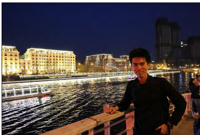
圖 9 天津市海河

建議前往中國時，攜帶臺灣的手機與門號一併前往，並準備第二支手機使用中國的門號 SIM 卡。由於 Line 會因為中國 SIM 卡的關係而無法開啟（即便使用 Wifi 翻牆亦同），故建議原本在臺灣使用的手機不要將臺灣的 SIM 卡拔除，並原封不動地帶往中國，在中國時，不要開啟 SIM 卡的「數據連線」功能，單純只將裝有臺灣 SIM 卡的手機作為接收簡訊、顯示未接來電使用，千萬不要用來打電話或接電話（在中國漫遊，不論是接電話還是打電話都要錢。此外，出國之前，記得先去原本的電信公司開通「國際漫遊」的服務，才可以在中國繼續使用臺灣的門號）。若裝有臺灣 SIM 卡的那支手機需要上網的話，就用中國 SIM 卡的手機進行熱點分享，或者利用現有的公共 Wifi 服務進行上網。