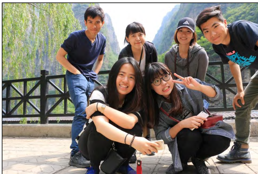
圖 18 北京市延慶區龍慶峽