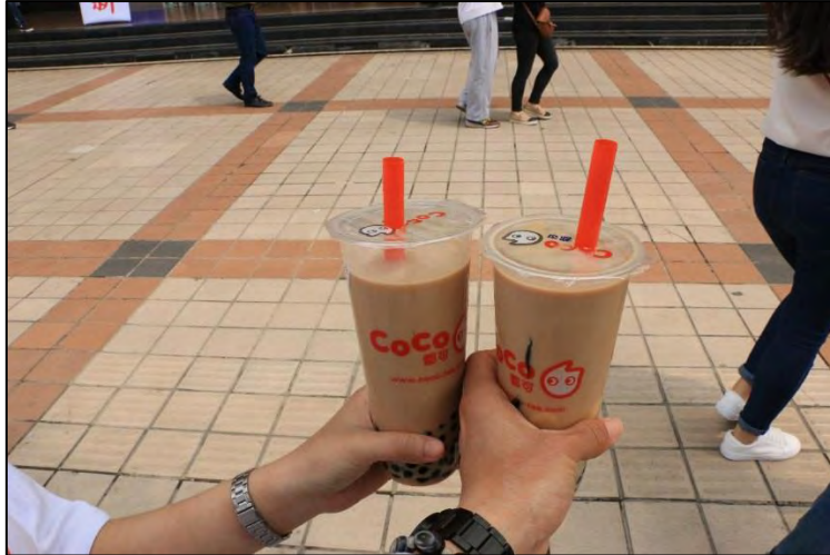
圖 14 北京難得的臺灣味道（味道真的完全一樣！）