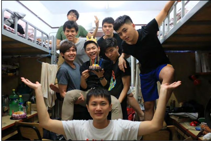
圖 22 品園 5 樓 121&118 聯盟