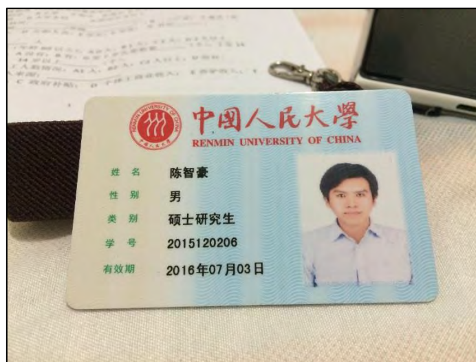
圖 7 中國人民大學學生 1 卡通（可當作學生證使用）

國銀行或中國工商銀行的帳戶，以便進行儲值，學生證的儲值必須透過綁定的金融卡進行轉入，無法以現金儲值，所以我們一般的儲值動作是，將人民幣現金以自動存款機存入銀行帳戶，再從位於每棟宿舍大廳、各大食堂門口、IT中心（位於中區食堂隔壁）的學生卡儲值機操作進行儲值。