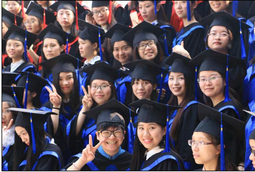
圖 21 中國人民大學社會與人口學院碩士研究生畢業班

在中國，我看見在臺灣消逝已久的人情。Simmel 曾提出陌生人的概念。從小我們被灌輸不要隨便與陌生人攀談、互動，從以往差序格局的「熟人社會」逐漸轉變成「陌生人社會」。中國，這個被許多人認為是人治的國家，在許多非都市的鄉村，仍保有那難能可貴「熟人社會」的影子，尤其是那毫無目的的親切問候，令人感到一絲心暖與溫熱。但在中國的都市裡，可真的不要隨意與陌生人互動才好，因為那份「相信」，已有許多臺灣同學被騙了許多錢（或是被計程車師傅、攤販、商店老闆隨意喊價而被坑了許多錢），所以有時，會讓我們覺得，在中國應該要如何相信人？要如何分辨好人、壞人才好？