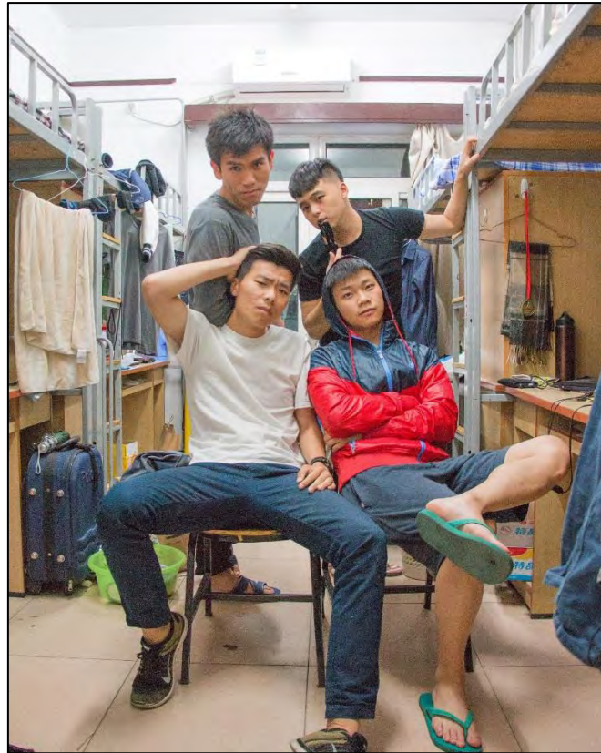
圖 20 中國人民大學品園 5 樓 121 室全體室友

政治在中國，是屬於知識份子與北京高官的話題，一般老百姓甚少瞭解。不過，在旅行的途中，還是偶爾會遇到當地民眾對於臺灣政治有著好奇，當被提及我們支持哪一黨時，我總是回答：「不管誰當領導，我都支持！」等等的中性的回答。身在他鄉，一定要謹言慎行，尤其當可能會造成自己的人身安全時。我們也必須了解，當前中國民眾的思想與認知，是建立在中國政府教育工具的社會控制底下，不難想像他們會有許多忠貞黨國的思想，我們不需要許改變他們，也不需要因為他們而改變自己，相互尊重即可。