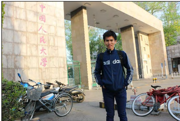
圖 2 中國人民大學東門 (正門)

中國 (People's Republic of China) 跟我們在電視上、書本上，以及我們所想像的不太一樣。但這個不一樣，我倒是跟其他曾經前往中國交換同學們的心得有所不同。我認為要瞭解一個國家，不能單單僅從書本上、電視上、媒體上去看待它，而是要住在當地一陣子，才能逐漸地瞭解它。