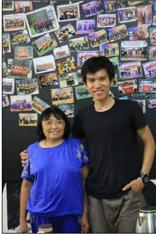
圖 19 福建晉江市陽光驛站（青旅）老闆娘（老闆娘的大舅也姓陳，1949 年隨著國民政府來臺，但至今音訊全無，對此，老闆娘希望我可以協助協找，但算一算，當事人也應該八九十歲了，不知應從何下手？）

不要被自己的意識形態，限定自己看待、挖掘中國的眼光。在中國，首先要確保自己的「人身安全」，不要因為自己的意識形態而使自己的人身安全受到損害。其次，自己心中要堅定自己的立場，即便可能在當地因為許多因素使自己需要「被迫」承認某些事，但自己內心堅定的立場，是不會輕易地遭受當地不合理的要求所約束。再者，有時候委屈自己的外顯表達，是一個很容易可以融入當地的「工具」。上述這點很重要，不要放棄難得來中國的機會，不要什麼也沒帶回國內。例如，在當地的用詞上，我盡量採用中性的用詞，「回國」我會說「回臺灣」，但我絕對不會用「島內」這個詞彙。盡量用「兩岸」這個語詞代替「大陸」（我沒有很喜歡這個詞彙，世界上沒有一個國家叫大陸，除非真的無法溝通的時候才會使用，我也堅決不使用「內地」這個詞彙，因為中華民國的內地是「南投」）。