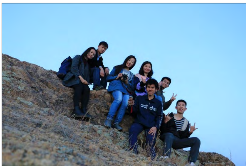
圖 13 公共管理學院的同學們

實習的主要內容分為三部分，一是為村子種樹並整理環境；二是透過挨家挨戶得訪查，瞭解村民對於當地村子的環境以及居住狀況，並進行問卷調查、村史瞭解（由於村長希望將後興隆地村打造成一個文化觀光的鄉村，故希望藉由村史的蒐集以及當地原始建物的修復、當地村子的生活習慣複製，讓來自都市的遊客、嚮往鄉村生活的退休人士、曾經居住在後興隆地村或鄰近村莊的外流人口，可以來後興隆地村重溫那份鄉村情懷。）；三是與村長、東阿阿膠公司經理、巴林左旗人民政府官員進行對話與討論。（補充說明，巴林左旗的「旗」，相當於我們所熟悉的「縣」，以縣命名者，為主要以農耕為主之地區；已旗命名者，則主要以畜牧為主之地區，即便當前內蒙古自治區內的各個旗區大都皆有大規模之農耕活動。）